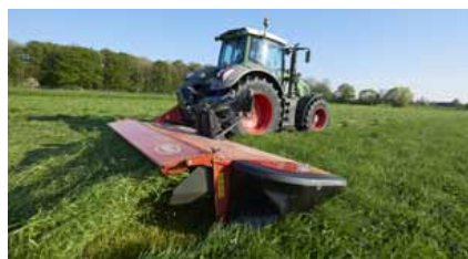
EXTRA 732T und 736T

Die EXTRA 732T und 736T, mit einzigartiger QuattroLink Aufhängung, total überarbeitetes Design und hydraulisch verstellbarer Arbeitsbreite.